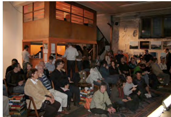
Hennes-Lokal, DU-Ruhrort

Anfang September wurde das mit dem Akzente-Projekt etablierte Hennes-Lokal mit "Performance Eins" wiedereröffnet. Seither dient es, zunächst befristet bis Ende 2008, TAD als Probenort und verschiedenen VeranstalterInnen als Ort für musikalische, filmische und performative Veröffentlichungen.