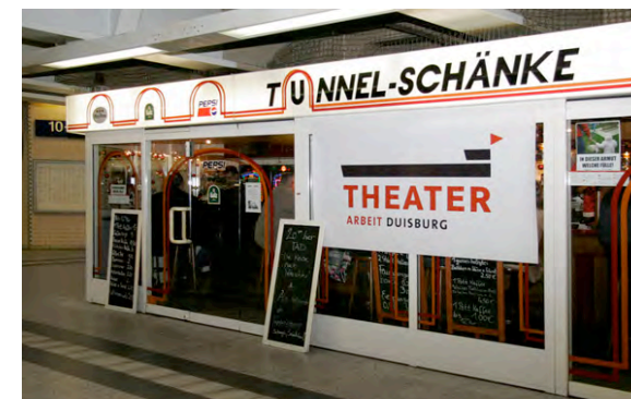
In dieser Armut welche Fülle! © Annette Jonak 2007

Zum Ende seines ersten Produktionsjahres initiierte TAD die Reihe "In dieser Armut welche Fülle! – TADvent" , die noch einmal das (fehlende) kulturelle Leben in Duisburg zu ihrem Ausgang hatte. An vier Adventstagen tauchte TAD hier an vier verschiedenen Orten mit kleineren Arbeiten auf – an Orten, die bislang kaum als (potentiell) künstlerische/kulturelle wahrgenommen wurden, wie z.B. einem Kiosk, einer Lichtskulptur, einer Kneipe. Diese Aktion kann als symptomatisch für den aktuellen Stand von TAD gesehen werden: Immer noch und immer mehr überzeugt, mit der Stadt Duisburg (und den hier lebenden Menschen) als Gesellschaft in nuce den idealen Forschungs- und Arbeitsort gewählt zu haben, hat sich TAD im ersten Jahr seines Bestehens zugleich schneller entwickelt, als in dieser Stadt allgemein nachvollziehbar. Die mit der Reihe TADvent an alle gerichtete Aufforderung, selbständig und eigenverantwortlich Orte für kulturelle Aktivität zu suchen, ist nicht zuletzt auch eine an uns selbst.