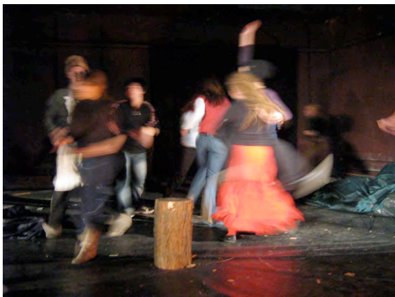
JTB: Wehikul Czasu – Die Zeitmaschine

Neben diesen drei Inszenierungen entstanden zwei internationale Produktionen des inzwischen zu Theater Arbeit Duisburg gehörigen Jungen Theater Bruckhausen (JTB): "Wehikul Czasu – Die Zeitmaschine" , frei nach H.G. Wells, sowie "Pogon za Sznacem – Die Jagd nach dem Schnatz" , frei nach L. Carroll. Diese – in erster Linie auf Improvisationen der beteiligten Jugendlichen beruhenden – Arbeiten entstanden in Kooperation mit dem Teatr Brama aus Goleniow (Polen). Die gemeinsamen Proben fanden in der internationalen Theaterbegegnungsstätte Schloss Bröllin (an der dt.-pl. Grenze) statt, Aufführungen im Januar und Juli 2007 in Bröllin, Szczecin, Berlin, Duisburg und Dortmund.