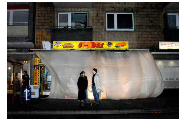
In dieser Armut welche Fülle! © Annette Jonak 2007 Verhüllte Skulptur "Kiosk ess-bar" (in Kooperation u.a. mit R. Bamberg, D. Czupryn, H. Malz, P. Micol)

Entsprechend diesem Selbstverständnis zeichnen sich die ersten TAD-Produktionen nicht durch eine einheitliche "ästhetische Handschrift" aus, sie sind formal betrachtet vielmehr disparat. Miteinander verbunden sind sie in gemeinsamer inhaltlicher Fragestellung und als Suchbewegungen an der Schnittstelle von künstlerischer und gesellschaftlicher Praxis. Daß sich bereits im ersten Produktionsjahr Kontakte zu und Kooperationen mit KünstlerInnen anderer Sparten ergaben, ist vor diesem Hintergrund eine konsequente Entwicklung.