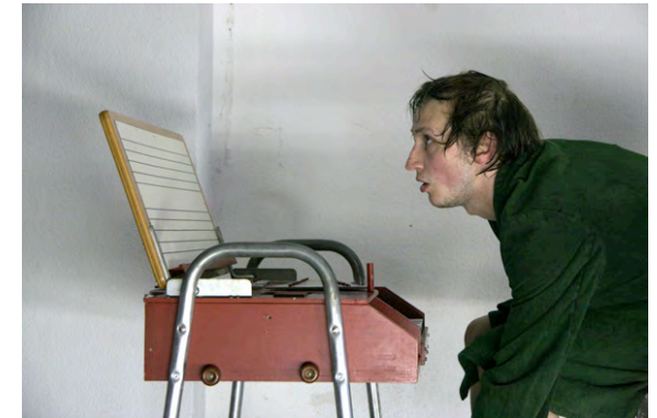
Meet John Doe

Die Produktion " Das Weiße wird uns immer fremder – Meet John Doe " (Koproduktion mit Theorie und Praxis e.V., Essen; Regie: Martin Kloepfer) basiert auf einem realen Ereignis in einer Duisburger Szenekneipe. Eines Nachts betrat ein dort zuvor nie gesehener Mensch dieses Lokal, ein Schwarzer, ein Amerikaner, ein Veteran des Irak-Krieges, der die ganze Kneipe einlud, mit ihm zu trinken. Es entstand sofort eine klassische Theatersituation. Auf der einen Seite gab es den – ziemlich kranken – Chor: die linksintellektuelle, praxisunfähige, depressive, defätistische Stammebelegschaft, auf der anderen Seite ein kraftstrotzendes, tatkräftiges, (zunächst) ostentativ fröhliches Individuum. Es war schon bald zu sehen, daß es hier zu keiner glücklichen Hochzeit beider Qualitäten kommen wird, und als die Nacht konsequenterweise mit der Zerstörung des Individuums und der darüber erfolgten Wiederherstellung der vom Chor vertretenen Ordnung endete, war die klassische Tragödie perfekt. Der Stücktext wurde aus Interviewpassagen mit den Zeugen dieses Ereignisses entwickelt. Ein halbes Jahr nach jener Nacht, am 2. Mai 2007, hatte die Inszenierung ihre Premiere im Theater Freudenhaus in Essen. Es folgten kurz darauf zwei Aufführungen im Modezentrum Zariza in Düsseldorf. Im Juni 2007 bildeten drei Aufführungen dieses Stücks das Herzstück des Projekts "10 Tage besser leben – TAD LOKAL" in Duisburg.