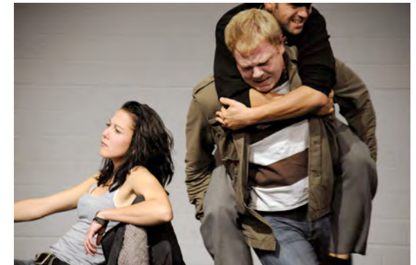
"Und keiner will der Kapitalist sein ..." – Zement. Probe Revolution

Die Inszenierung entstand in Kooperation mit Theorie und Praxis e.V. und als Koproduktion mit dem Ringlokschuppen Mülheim. Die Premiere und zwei Folgeaufführungen fanden Oktober 2008 in Mülheim statt, zwei weitere im Hennes-Lokal. Flankiert wurden die Aufführungen von theoretischen Veranstaltungen: einer Lesung von Bini Adamczak in Mülheim und einem Seminar von Theorie und Praxis in Duisburg.