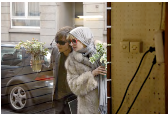
Our Town. Ruhrort

Die Premiere von "Our Town. Ruhrort" (Regie: Martin Kloepfer) eröffnete Ende Mai 2008 die Reihe abschließender Veröffentlichungen während der Festivalzeit der Duisburger Akzente. Mit der zweiten Aufführung von "SeemannsHeim" (Regie: Stella Cristofolini) endete das Ruhrorter Akzente-Projekt.