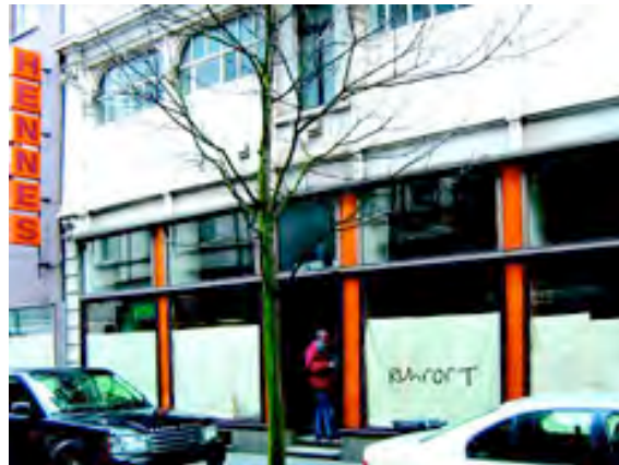
Ehemalige Eisenwarenhandlung Hennes Arbeits- und Aufführungsort von TAD in Duisburg-Ruhrort

Forschung in Ruhrort ist nur ein Anfang. Im Rahmen der "Kulturhauptstadt Ruhr 2010" wird diese Arbeit ihren Abschluß finden – allerdings wiederum nur einen vorläufigen, denn das Bestreben von TAD und seinen PartnerInnen in diesem Projekt ist es, eine über dieses Kulturhauptstadtjahr hinaus existierende Struktur für weitere künstlerische/kulturelle Arbeit in Duisburg-Ruhrort zu erschaffen.