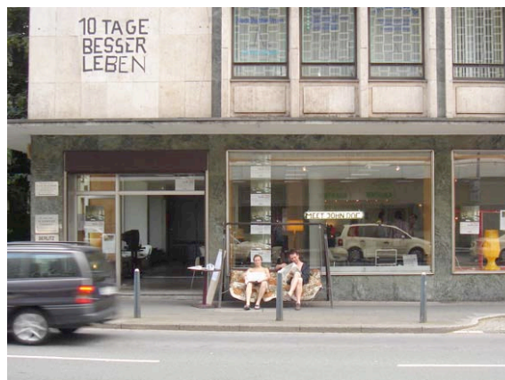
10 Tage besser leben – TAD LOKAL

Ursprünglich aus der Not, daß für die begonnene professionelle Theaterarbeit in Duisburg kein adäquater Partner als Veranstalter existiert, wurde die Idee zu " 10 Tage besser leben – TAD LOKAL " geboren.