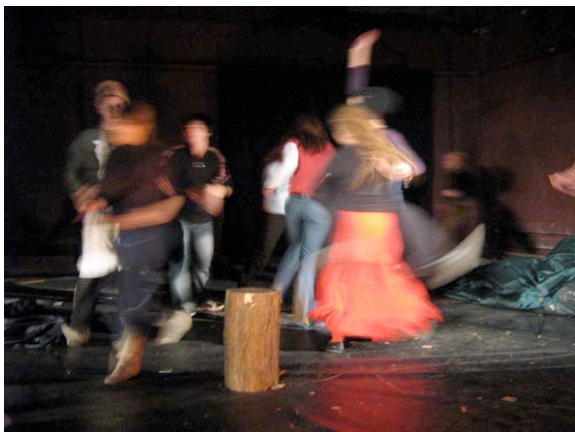
JTB: Wehikul Czasu – Die Zeitmaschine

Neben diesen drei Inszenierungen entstanden zwei internationale Produktionen des inzwischen zu Theater Arbeit Duisburg gehörigen Jungen Theater Bruckhausen (JTB): " Wehikul Czasu – Die Zeitmaschine ", frei nach H.G. Wells, sowie " Pogon za Sznacem – Die Jagd nach dem Schnatz ", frei nach L. Carroll. Diese – in erster Linie auf Improvisationen der beteiligten Jugendlichen beruhenden – Arbeiten entstanden in Kooperation mit dem Teatr Brama aus Goleniow (Polen). Die gemeinsamen Proben fanden in der internationalen Theaterbegegnungsstätte Schloss Bröllin (an der dt.-pl. Grenze) statt, Aufführungen im Januar und Juli 2007 in Bröllin, Szczecin, Berlin, Duisburg und Dortmund.