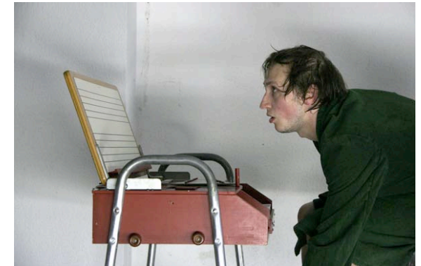
Meet John Doe

Die Produktion " Das Weiße wird uns immer fremder – Meet John Doe " (Regie: Martin Klopfer) basiert auf einem realen Ereignis in einer Duisburger Szenekneipe. Eines Nachts betrat ein dort zuvor nie gesehener Mensch dieses Lokal, ein Schwarzer, ein Amerikaner, ein Veteran des Irak-Krieges, der die ganze Kneipe einlud, mit ihm zu trinken. Es entstand sofort eine klassische Theatersituation. Auf der einen Seite gab es den – ziemlich kranken – Chor: die linksintellektuelle, praxisunfähige, depressive, defätistische Stammebelegschaft, auf der anderen Seite ein kraftstrotzendes, tatkräftiges, (zunächst) ostentativ fröhliches Individuum. Es war schon bald zu sehen, daß es hier zu keiner glücklichen Hochzeit beider Qualitäten kommen wird, und als die Nacht konsequenterweise mit der Zerstörung des Individuums und der darüber erfolgten Wiederherstellung der vom Chor vertretenen Ordnung endete, war die klassische Tragödie perfekt. Der Stücktext wurde aus Interviewpassagen mit den Zeugen dieses Ereignisses entwickelt. Ein halbes Jahr nach jener Nacht, am 2. Mai 2007, hatte die Inszenierung ihre Premiere im Theater Freudenhaus in Essen. Es folgten kurz darauf zwei Aufführungen im Modezentrum Zariza in Düsseldorf. Im Juni 2007 bildeten drei Aufführungen dieses Stücks das Herzstück des Projekts "10 Tage besser leben – TAD LOKAL" in Duisburg.