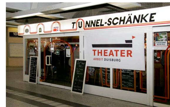
In dieser Armut welche Fülle!

Zum Ende seines ersten Produktionsjahres initiierte TAD die Reihe " In dieser Armut welche Fülle! – TADvent ", die noch einmal das (fehlende) kulturelle Leben in Duisburg zu ihrem Ausgang hatte. An vier Adventstagen tauchte TAD hier an vier verschiedenen Orten mit kleineren Arbeiten auf – an Orten, die bislang kaum als (potentiell) künstlerische/kulturelle wahrgenommen wurden, wie z.B. einem Kiosk, einer Lichtskulptur, einer Kneipe. Diese Aktion kann als symptomatisch für den aktuellen Stand von TAD gesehen werden: Immer noch und immer mehr überzeugt, mit der Stadt Duisburg (und den hier lebenden Menschen) als Gesellschaft in nuce den idealen Forschungs- und Arbeitsort gewählt zu haben, hat sich TAD im ersten Jahr seines Bestehens zugleich schneller entwickelt, als in dieser Stadt allgemein nachvollziehbar. Die mit der Reihe TADvent an alle gerichtete Aufforderung, selbständig und eigenverantwortlich Orte für kulturelle Aktivität zu suchen, ist nicht zuletzt auch eine an uns selbst.