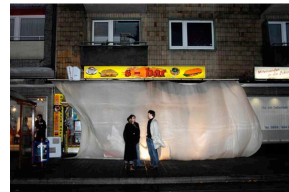
In dieser Armut welche Fülle! © Annette Jonak 2007 Verhüllte Skulptur "Kiosk ess-bar" (in Kooperation u.a. mit R. Bamberg, D. Czupryn, H. Malz, P. Micol)

Entsprechend diesem Selbstverständnis zeichnen sich die ersten TAD-Produktionen nicht durch eine einheitliche "ästhetische Handschrift" aus, sie sind formal betrachtet vielmehr disparat. Miteinander verbunden sind sie in gemeinsamer inhaltlicher Fragestellung und als Suchbewegungen an der Schnittstelle von künstlerischer und gesellschaftlicher Praxis. Daß sich bereits im ersten Produktionsjahr Kontakte zu und Kooperationen mit KünstlerInnen anderer Sparten ergaben, ist vor diesem Hintergrund eine konsequente Entwicklung.