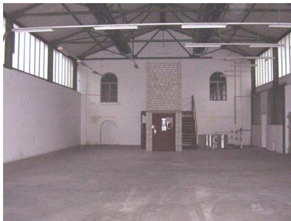
Duisburg Ruhrort, Alte Packhalle Möglicher Spielort für "Z.B. Ruhrort – Arbeit und Leben ..."

hauptstadt Ruhgebiet 2010" wird diese Arbeit ihren Abschluß finden – allerdings wiederum nur einen vorläufigen, denn das Bestreben von TAD und seinen PartnerInnen in diesem Projekt ist es, eine über dieses Kulturhauptstadtjahr hinaus existierende Struktur für weitere künstlerische/kulturelle Arbeit in Ruhrort zu erschaffen.